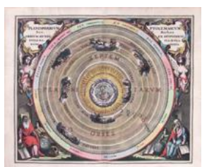
Antikken: Bevegelsene i de himmelse baner basert på Ptolemaios' teorier. HARMONIA MACROCOSMICA