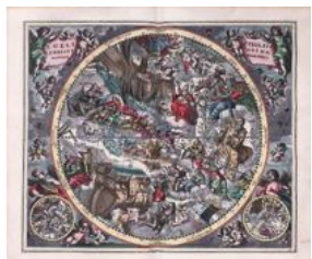
Kristendom: Første hemisfære med firmament formet i kristendommens bilde. HARMONIA MACROCOSMICA

bort ifra forestillingen om at det var Gud som sto bak opprettelsen av de mange verdene, og snakket i stedet om virvelvinder og selvgående solsystemer. Denne mekanikken ble for mange tung å svelge, og Leibniz rykket snart ut for å forsikre leserne om at også Fontenelles soler og planeter inngikk i Guds ene verden. Det Leibniz i sin Théodicée kalte for «verden» omfatter nemlig hele kjeden av alt som eksisterer, noe som utelukker at det skulle finnes verdener i flertall: «For det er nødvendig å telle alle sammen som en verden, eller om De vil, som et univers.»